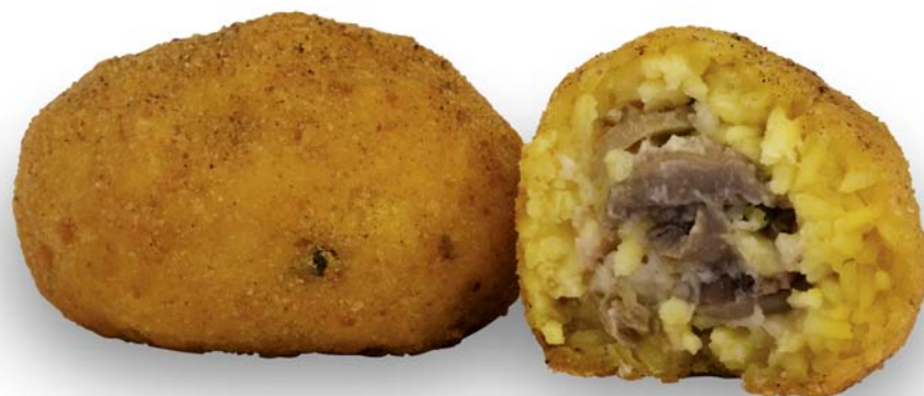
arancini alla boscaiola

The arancini are typical products for eating-out like small filled oranges. The arancini can have different stuffing: ragù and mozzarella cheese, spinaches, butter and mozzarella cheese, mushrooms and peas.