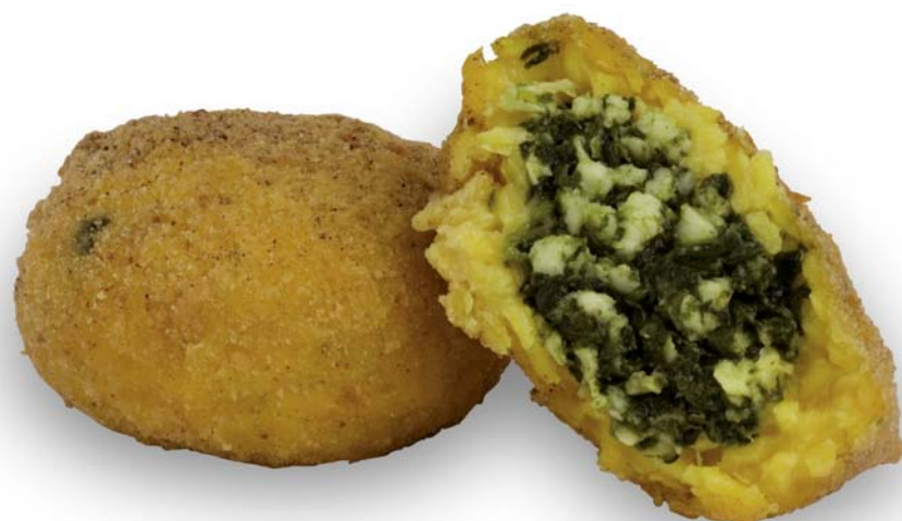
arancini agli spinaci

Cod. 118- g. 200 (da friggere) Cod. 123 - g. 200 (precotti)