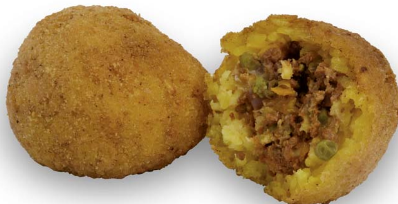
arancini al ragù