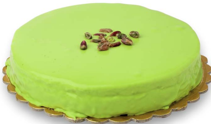
sette strati di bontà

Seven layers of tastiness, with pistacho, hazel-nuts, chocolate sponge-cake, flakes of white chocolate.