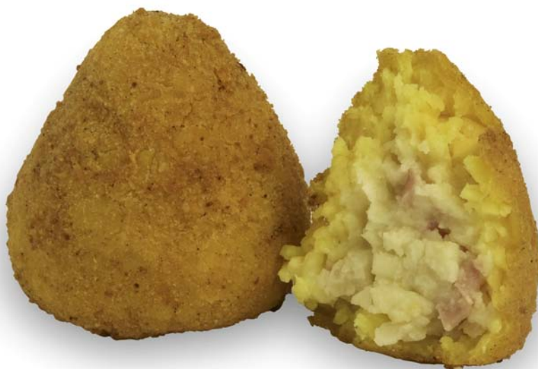
arancini al burro