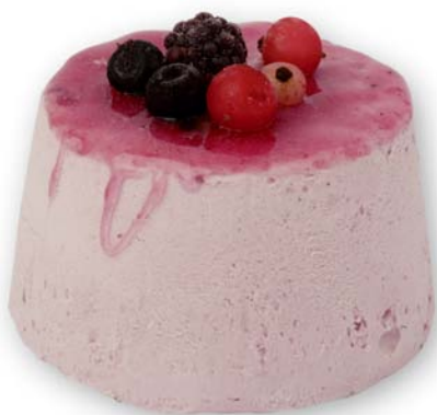
Frutti di bosco