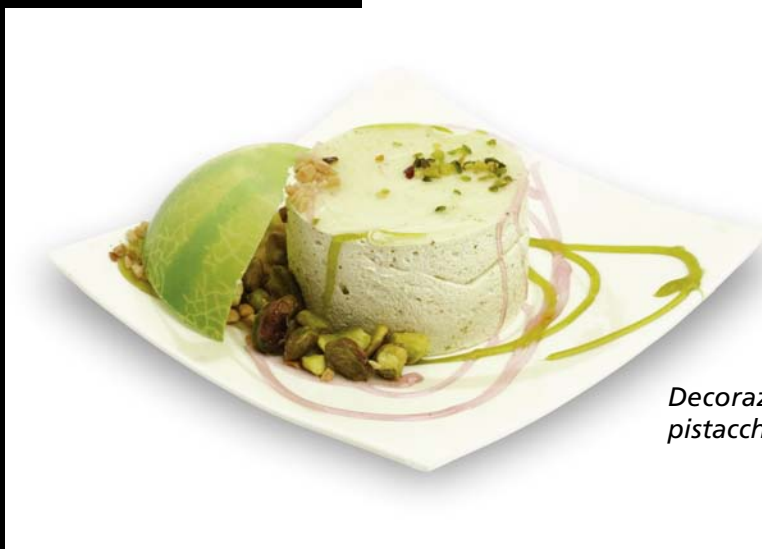
Decorazione con pistacchio, gelatina al pistacchio, guscio di cioccolato bianco.

Nelle foto di questa pagina sono presentate due esempi di presentazione del prodotto decorato con fantasia e gusto dai nostri maestri pasticceri.