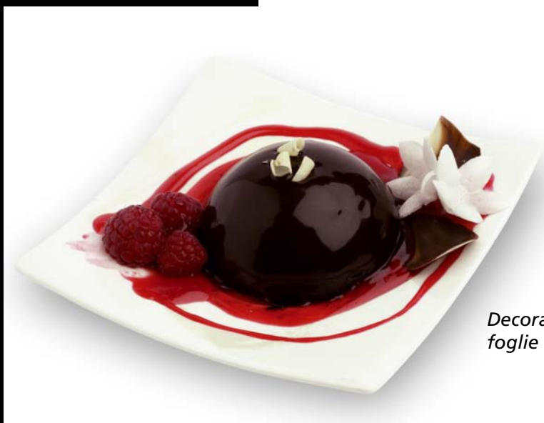
Decorazione con salsa ai frutti di bosco, foglie di cioccolato, frutta fresca.

L'attenzione ad uno stile alimentare equilibrato accompagna sempre di più anche i pasti fuori casa. Il ristoratore, attraverso la sua arte culinaria, deve poter proporre quella cura del cibo e dei condimenti con ricette gustose, golose e sfiziose, capaci però nello stesso tempo di rassicurare coloro che desiderano mangiare oltre che per piacere per stare bene.