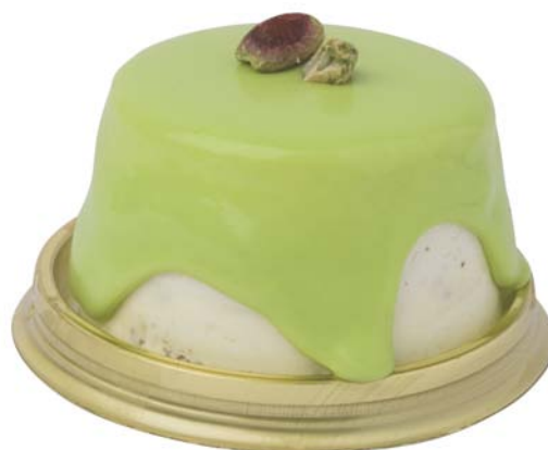
sette strati di bontà